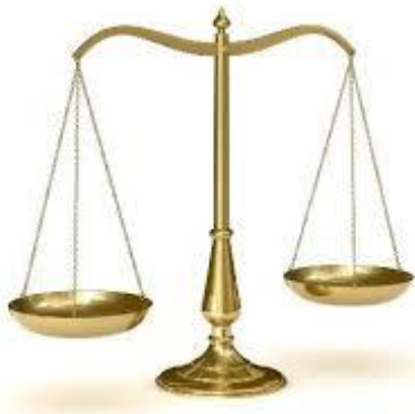
Balanza con fiel central

Este concepto se puede con dos tipos de balanza: la del fiel central que representaría una composición simétrica y la del fiel descentrado, en la cual los dos pesos están situados a distancias desiguales; este tipo de balanza representaría una composición asimétrica