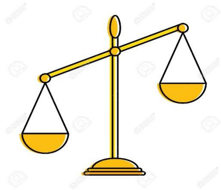
Balanza romana con fiel descentrado