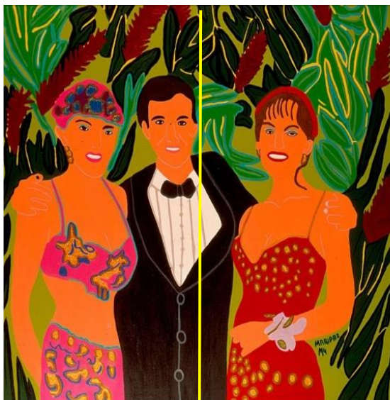
Reinas tropicales, 1994, acrílico sobre tela